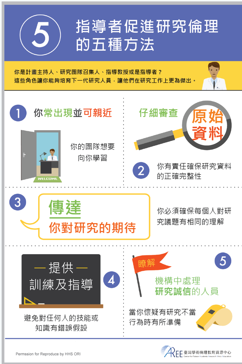
圖 1 指導者促進研究倫理的五種方法